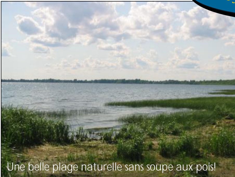
Une belle plage naturelle sans soupe aux pois!