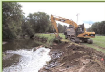
Adoucissement de la pente

Pour stabiliser la berge à long terme, la technique mixte utilisée a été l'enrochement et la végétalisation avec des arbustes. Un adoucissement de pente a été nécessaire pour procurer une meilleure stabilité de l'ouvrage.