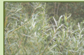
Saule de l'intérieur

Le saule de l'intérieur ( Salix interior ) est une des espèces les plus utilisées dans ce type d'aménagement. Les racines de ce petit arbuste forment rapidement des stolons qui sont des rejets à la base de la tige permettant la multiplication rapide du plant. Sa tige flexible permet de résister à l'action des glaces.