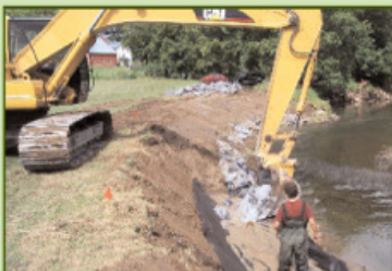
Clé avec pose de toile géotextile et pierres

Une toile géotextile a été installée avant de déposer les pierres. Cette toile permet de retenir le sol entre les pierres, diminuant ainsi les apports de particules en suspension dans l'eau et permettant aux plantes de s'y enraciner.