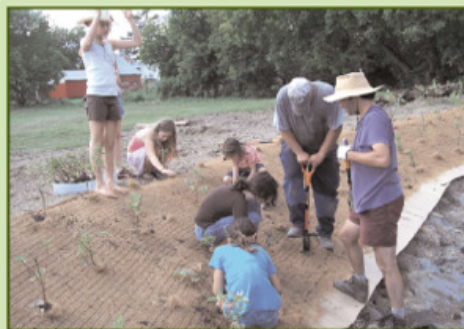
Plantation sur le paillis protecteur

À partir du milieu du talus jusque sur le replat de la berge, la plantation d'arbustes permet de stabiliser le sol par le réseau racinaire qui s'y développe. Pour éviter que le sol ne s'érode avant la croissance des arbustes, une bande cartonnée et une natte en fibre de noix de coco biodégradable ont été fixées au sol avec des tiges d'ancrage. Ce paillis protège les arbustes récemment plantés contre la compétition par les plantes herbacées et l'érosion du sol de la berge lors des crues.