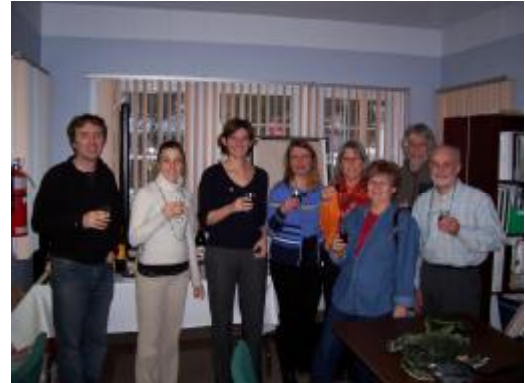
Réunion d'information du comité