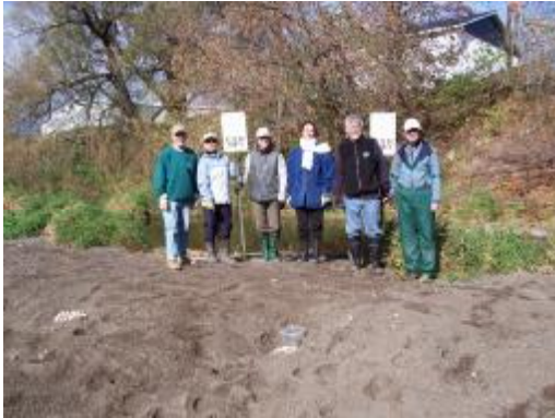
Sites de ponte trouvés avec les coquilles d'œufs