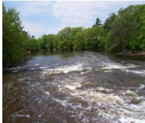
Photo : Rivière aux Brochets à Bedford

Dans le cours moyen de la rivière, le volume d'eau est plus grand, mais la vitesse est plus lente. L'eau plus chaude est moins claire et le fond est composé de sable et de graviers. Les algues peuvent recouvrir les cailloux et les plantes aquatiques s'enracinent dans le sable. Les invertébrés peuvent s'y accrocher et les écrevisses se cachent entre les cailloux. C'est le domaine préféré des animaux pêcheurs : la loutre raffole des écrevisses, le grand harle fait de la plongée, le chevalier grivelé fouille le littoral et le martin pêcheur niche dans un terrier ! On peut rencontrer des tortues peintes qui se rassemblent pour un bain de soleil sur les branches échouées près de la rive et des tortues des bois cachées dans la végétation.