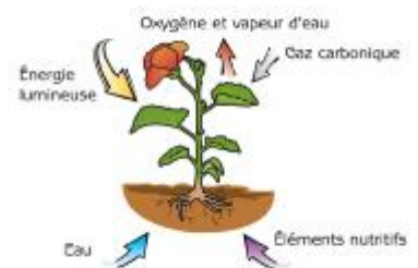
Schéma de la photosynthèse

La photosynthèse est à la base de la chaîne alimentaire. Les feuilles captent l'énergie du soleil par la chlorophylle, leur pigment vert, ainsi que le gaz carbonique. La plante transforme alors le carbone de ce gaz carbonique en tissu végétal (matière organique) avec l'eau et les éléments nutritifs puisés par les racines dans le sol.