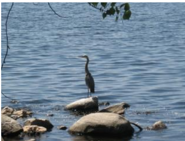
Photo : Grand héron à la baie Missisquoi