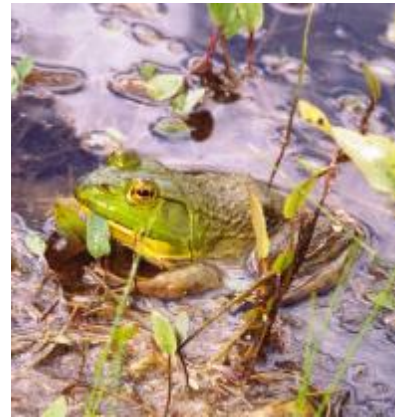
Photo : Ouaouaron

Le marais est le royaume des amphibiens et des reptiles : salamandre maculée, crapaud d'Amérique, rainette crucifère, grenouille léopard, grenouille des marais, grenouille verte, ouaouaron, tortue serpentine, tortue peinte, couleuvre rayée, couleuvre d'eau. Les mammifères s'y promènent également. L'orignal peut y passer toute la journée à manger des plantes aquatiques et il peut rencontrer en bordure le cerf de Virginie, le porc-épic et même l'ours noir. Les animaux carnivores visitent le marais pour pêcher ou chasser : hermine, belette, vison, loutre, lynx roux. Ils se nourrissent de campagnols, de musaraignes ou de souris sauteuses, en plus des grenouilles, des insectes et des poissons.